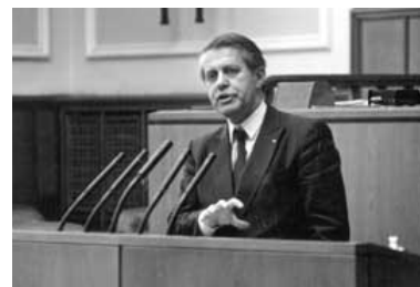
Karl Otto Meyer

Seit Mitte der 70'er Jahre waren die Wahlergebnisse des SSW auch nicht mehr rückläufig. Zudem war er mehrmals das Zünglein an der Waage, wenn eine Landesregierung gebildet wurde. Dies führte zu einem steigenden Interesse der anderen Parteien und der Öffentlichkeit.