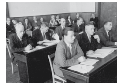
Der ersten dänischen Fraktion im Landtag gehörten 1947 sechs Abgeordnete an.

Die Kommunalwahl 1946 wurde zum Triumph für die Kandidaten des Südschleswigschen Vereins (SSV) und der dänischgesinnten Sozialdemokratischen Partei Flensburgs (SPF).