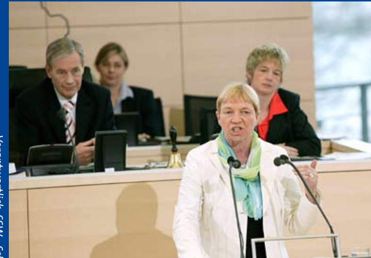
Verantwortlich: SSW - Schiffbrücke 42 - 24939 Flensburg - Tel. 0461-144 08 310 - info@ssw.de