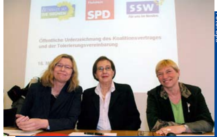
Es ist heute europäische Normalität, dass Minderheitenparteien über die Regierungsbildung mitentscheiden.

Es ist schon längst Normalität, dass sich Regierungen auf die Stimmen von den weit über 100 nationalen Minderheiten in Europa stützen: Die ungarische Minderheit in Rumänien hat in einer Koalitionsregierung gesessen, die schwedische Minderheit in Finnland unterstützt schon seit den 1930er Jahren viele Regierungen aktiv und in Spanien haben katalanische Parteien in der Zentralregierung in Madrid mitregiert – um nur einige Beispiele zu nennen. Dass Minderheitenparteien sich auf ein wahlrechtliches Privileg stützen, ist auch keine Aus-