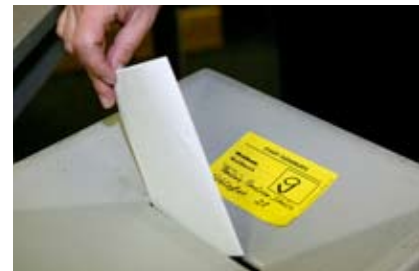
Die Stimme eines SSW-Wählers ist ebenso viel wert wie die aller anderer Bürger.

Die Menschen in der dänischen Minderheit sind Staatsbürger in diesem Land und werden von allen politischen Fragen berührt, deshalb kann es für uns nicht nur um Minderheitenrechte und Zuschüsse für dänische Einrichtungen gehen. Von daher hat sich der SSW seit seiner Gründung 1948 immer auch um allgemeine politische Fragen gekümmert. Keine Partei, auch nicht die CDU, hat sich darüber beschwert, dass der SSW im Landtag seit Jahrzehnten ganz selbstverständlich zu allen Fragen Stellung bezogen und bei allen Fragen mit abgestimmt hat.