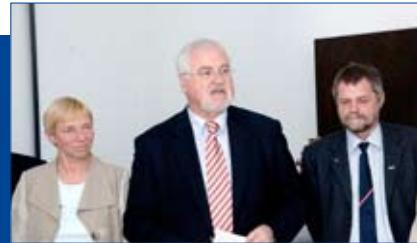
Der SSW hat nach der Wahl auch mit der CDU verhandelt.

Nach der Landtagswahl hat der SSW Sondierungsgespräche mit beiden Seiten geführt. Die CDU forderte aber in diesen Gesprächen, dass der SSW „neutral bleibt“. Wenn eine Entscheidung nicht mit den Grundsätzen des SSW vereinbar ist, sollten wir uns der Stimme enthalten und so CDU/FDP zu einer dauerhaften Mehrheit verhelfen. Aber in der Politik gibt es keine „Neutralität“. Mit unserer Enthaltung hätten wir auch Seite gewählt: Wir hätten passiv die gesamte Regierungspolitik von CDU/FDP akzeptiert, ohne selbst politischen Einfluss zu suchen. Damit hätten wir unsere eigenen 51.920 Wähler im Stich gelassen - und die SSW-Abgeordneten hätten für fünf Jahre nach Hause gehen können. Es blieb uns also gar keine