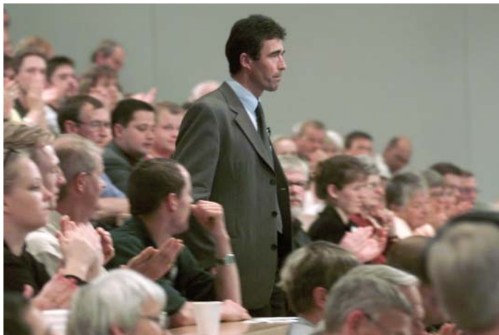
Der dänische Ministerpräsident Fogh Rasmussen bei der großen dänischen Bürgeranhörung zur EU im Frühjahr 2006.